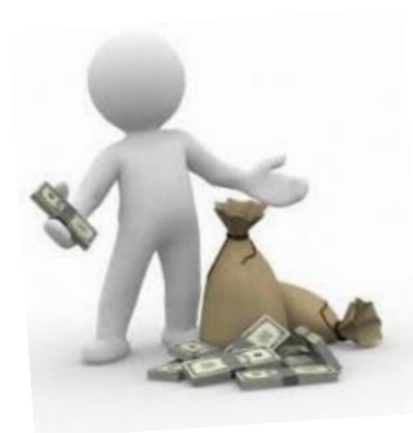
Xorazm viloyati Demografiya va mehnat statistikasi bolimi